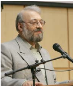
محمد جواد لاریجانی، دبیر شورای عالی حقوق بشر ایران

ادعاهای بسیاری از فرستاده‌های ایرانی ناقض مدارکی موجود در گزارشهای مرکز اسناد حقوق بشر ایران درباره وضعیت زندانها، رفتار با بهاییها، و سرکوب مخالفان بعد از انتخابات می‌باشند.